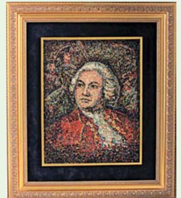
На снимке: это портрет М.В. Ломоносова, выполненный в мозаике к его 300-летию. Не многим известно, что ученый был величайшим поклонником мозаики и ее талантливым творцом. М.В. Ломоносов изображен на фоне его знаменитой мозаики – «Полтавская баталия».